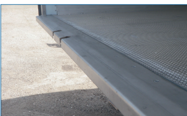
Kraftig bagramme i rustfri stål