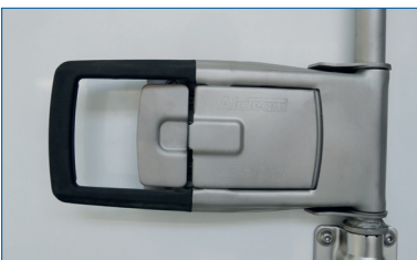
Lås i rustfri