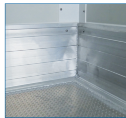
Sparkeplade i alu, sparkeplade i sider