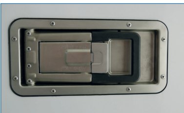
Lås i rustfri