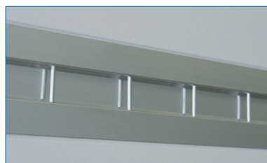
Indfældet møbel surring